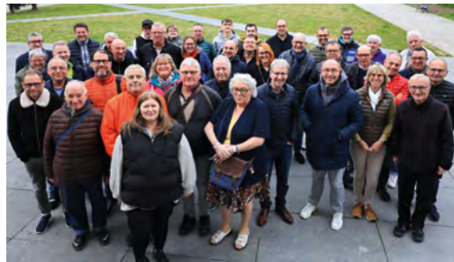
La Ronde des Sources