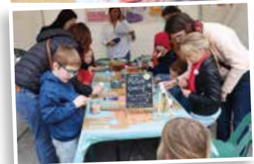
▶ Des chapiteaux sous lesquels se faire maquiller, colorier, coller, créer, écouter des histoires, découvrir le compostage, la grainothèque de la médiathèque...