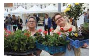
▶ De bons moments savourés