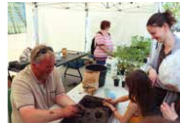
▶ Des bombes de graines florales à jeter dans son jardin