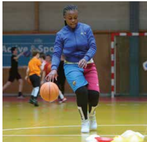
Vacances de printemps