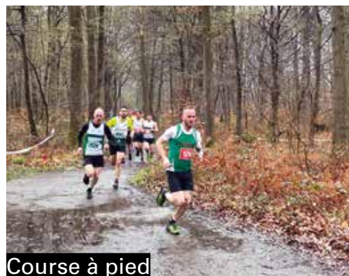
Course à pied