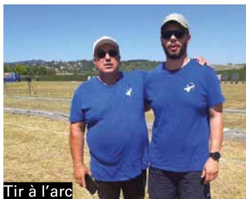
Tir à l'arc