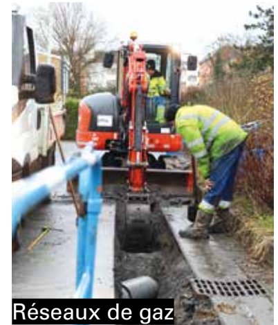
Réseaux de gaz