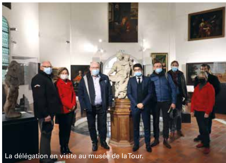
La délégation en visite au musée de la Tour.

Une visite sur le terrain a suivi cette réunion très fructueuse et réconfortante pour l'avenir.