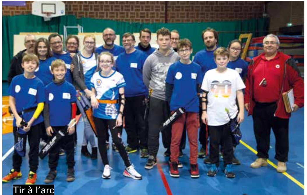
Tir à l'arc