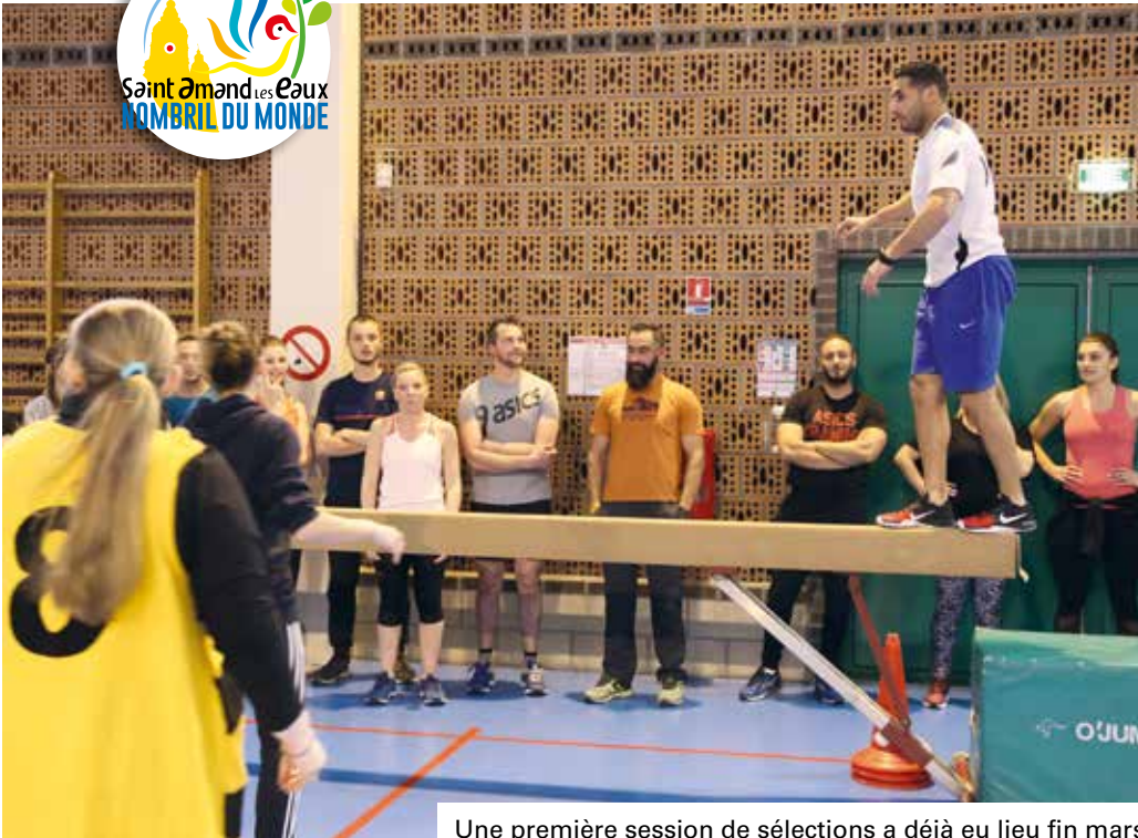
Une première session de sélections a déjà eu lieu fin mars.