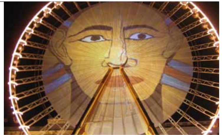
La fête des lumières telle qu'elle se conçoit à Lyon.