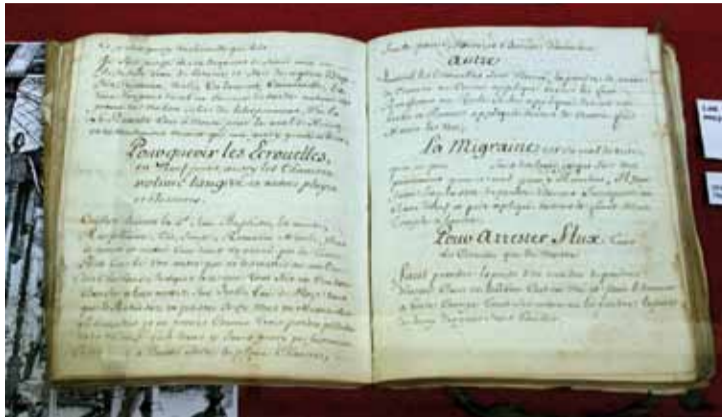
L'une des dernières acquisitions de la médiathèque